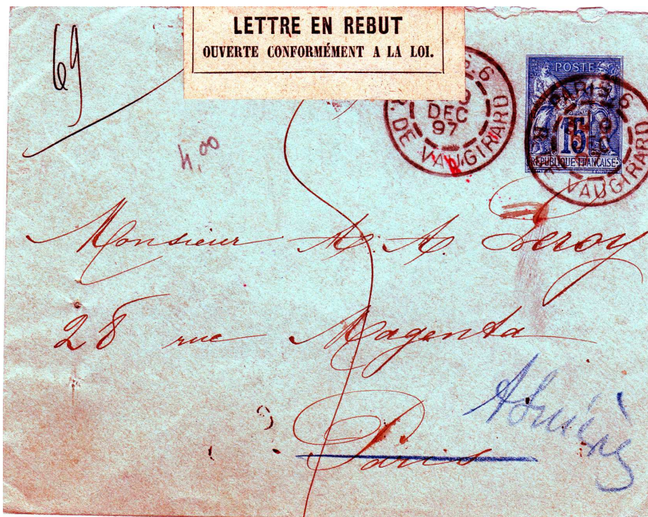
Lettre du 9 décembre 1897 affranchie 15 centimes de Paris pour Paris avec une rue inconnue (rue Magenta au lieu de Bld Magenta).